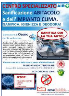
Cartellonato Centro Specializzato