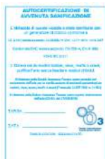
50 x tagliando sanificazione