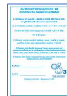
Tagliando avvenuta sanificazione x 50