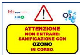
Piramide segnaletica sanificazione in corso