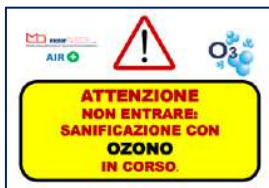
Piramide segnaletica sanificazione in corso