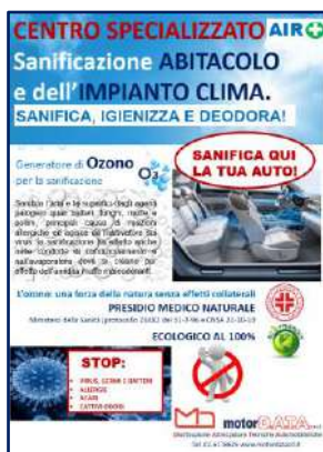
Cartellone Centro Specializzato

ACQUISTABILE SOLO CONTESTUALMENTE AD UN GENERATORE