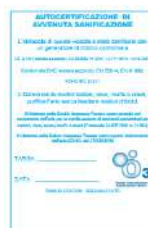
50 x tagliando sanificazione