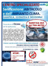
Espositore da banco