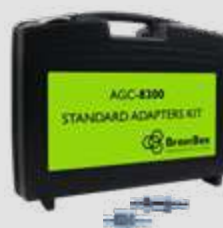
AGC-8300 STANDARD ADAPTER KIT

L'adattatore giusto è indicato sul display della stazione, quindi la tranquillità è garantita. Un database opzionale è disponibile per una gamma più ampia di possibili applicazioni..