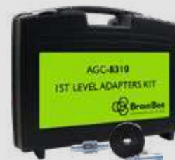
AGC-8310 LEVEL 1 ADAPTER KIT