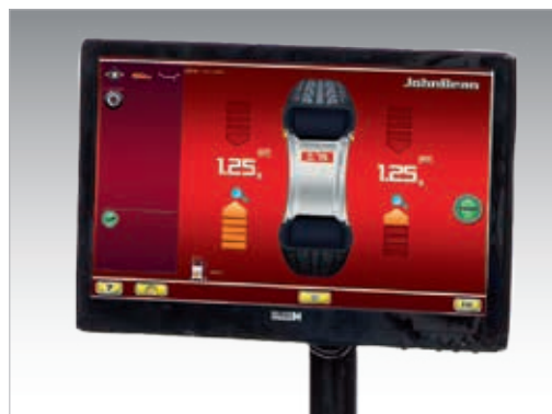
Interfaccia utente platinum