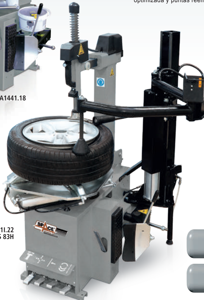
GA2441.22 + PLUS 83H