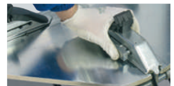
10" - 24" (2 position)