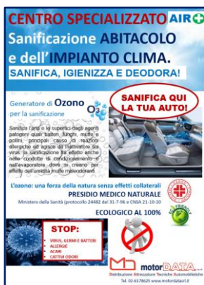
Cartellonato Centro Specializzato