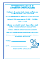
Tagliando avvenuta sanificazione x 50