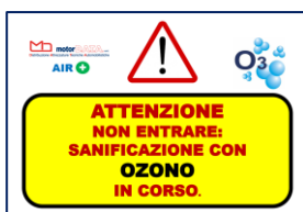
Piramide segnaletica sanificazione in corso