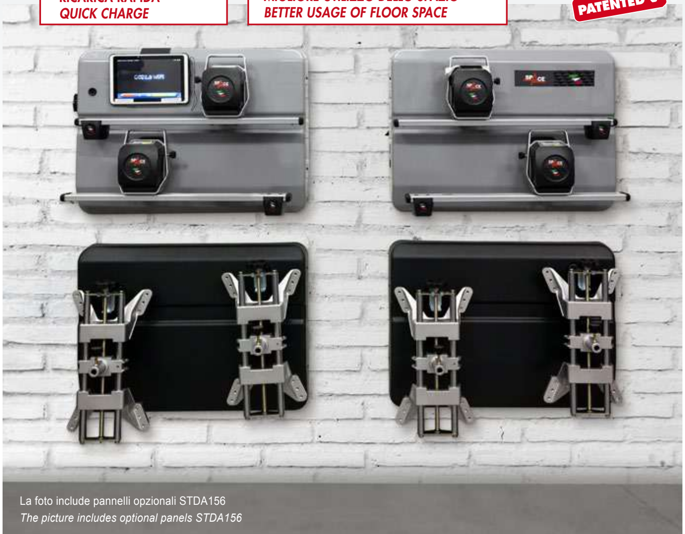
La foto include pannelli opzionali STDA156 The picture includes optional panels STDA156

Due pannelli a parete per l'alloggiamento e la ricarica del tablet e dei rilevatori. Two wall panels allow housing and recharging of tablet and measuring-heads. Zwei Wand-Panele mit Ablage und Ladestation des Tablets und der Messköpfe. Deux panneaux muraux pour rangement et charge de la tablette et des têtes. Dos paneles de pared para almacenamiento y carga de los captadores.